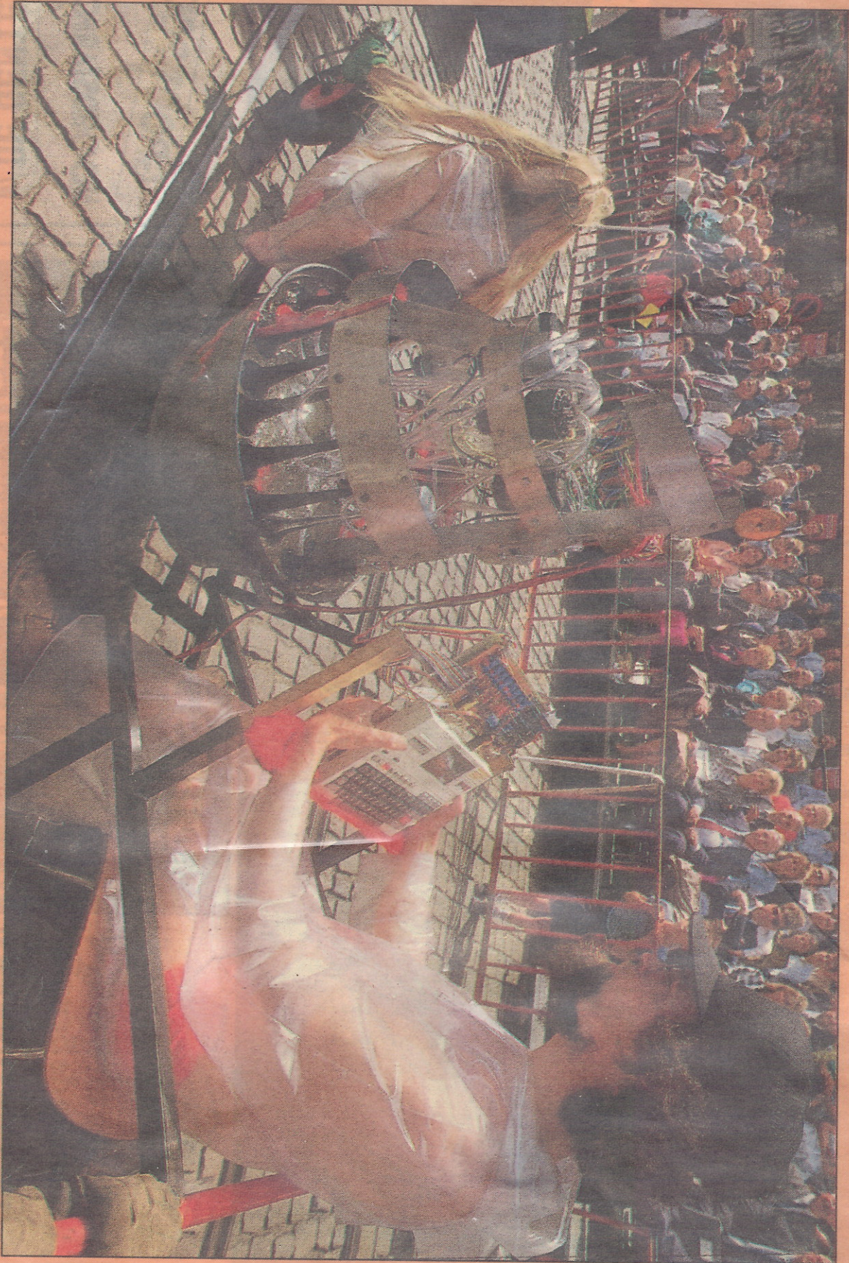
Logos (het laboratorium voor avant-gardemuziek) laat autoklaxons in (regen?)water blubberende en toerende geluiden produceren.