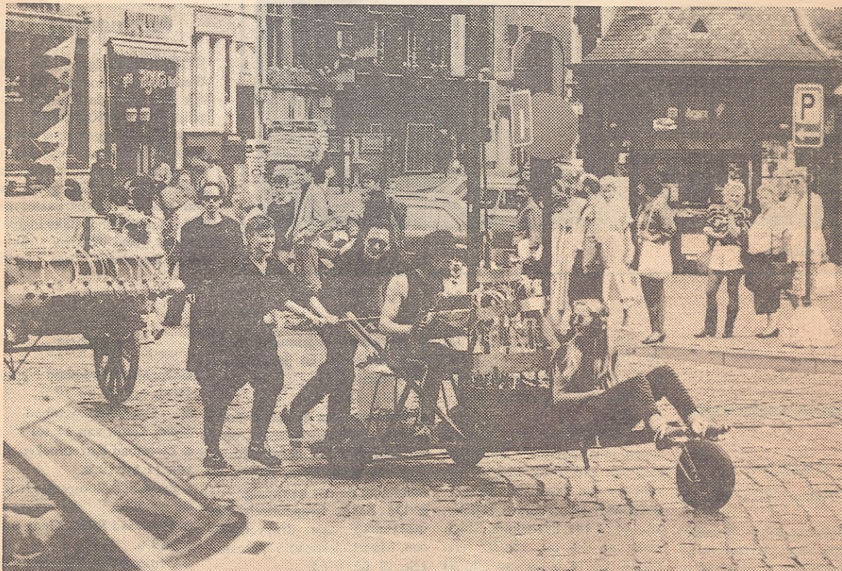
De toetkuip: een vreemdsoortig fietsinstrument brengt leven in de stille Gentse straten.